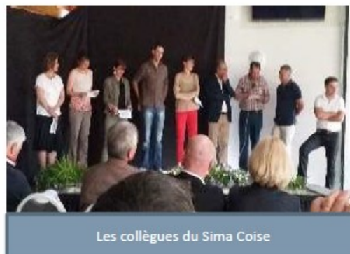
Les collègues du Sima Coise